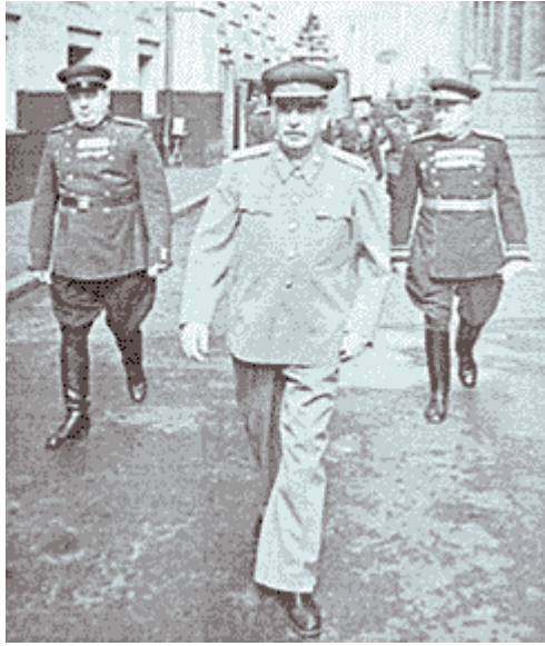
Staline avec des Maréchaux soviétiques avant la parade de la victoire, en juin 1945.