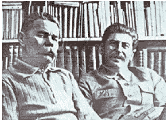
Staline avec le grand écrivain populaire russe, Maxime Gorki, en 1936.