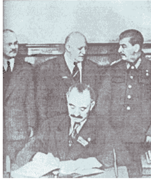
Signature du traité d'amitié et de coopération entre la Bulgarie et l'Union Soviétique en 1948.