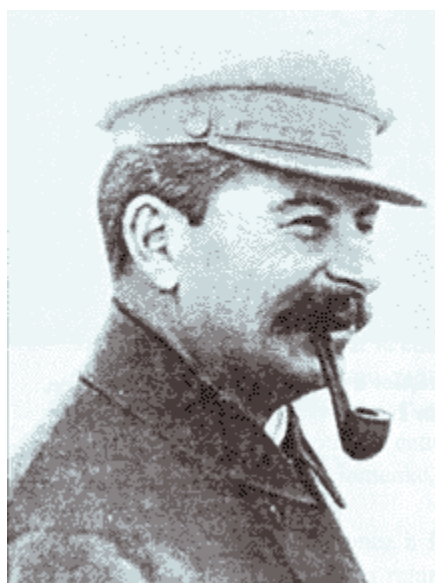
Le deuxième plan quinquennal est réussi, 1937.