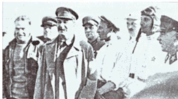
Staline avec des pilotes soviétiques, en 1935.